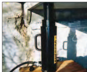
◀ Переносной цилиндр RACL-1506 со стопорной гайкой, используемый для удержания груза во время заливания эпоксидной смолы при укреплении моста.