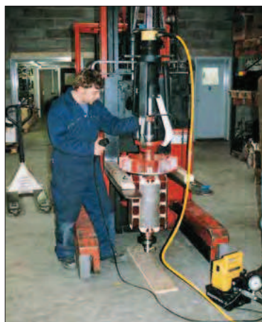
← EPHR-116 используется для снятия шкивов электромоторов. Съемник устанавливается при помощи подъемной плиты.