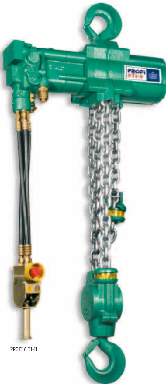
PROFI 6 TI-H